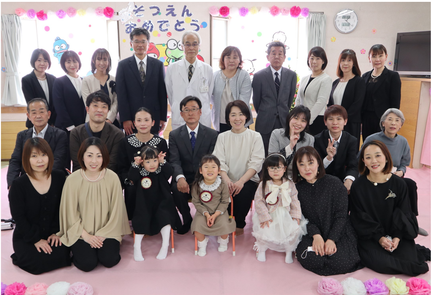
宮田病院 ひよこ保育園 第29回卒園式 令和5年3月11日